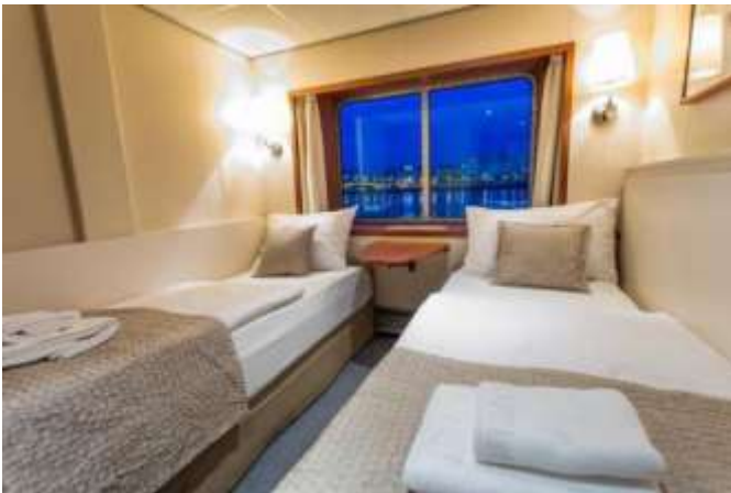
CABINE STANDARD PONT PRINCIPAL