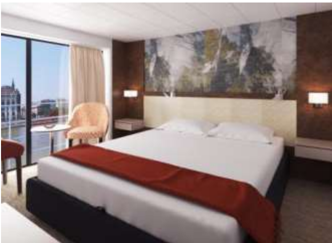
DELUXE – PONT SUPERIEUR – PONT INTERMEDIAIRE