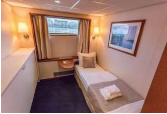
CABINE STANDARD – PONT BAS