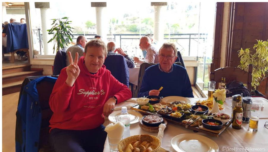
Repas typique en Albanie