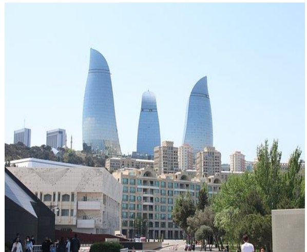
Extension possible de votre voyage en Arménie ou Azerbaïdjan